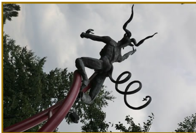
Foto: Het Duvelsklökske is een kunstwerk van Mirjam Verheijen, opgesteld voor de ingang van de St. Jan de Doperkerk, dat teruggrijpt op een 17e eeuwse legende (zie beschrijving op onze website).

Wil, hartelijk dank voor dit interview. Wij hopen dat je met al je ervaring nog lang actief mag blijven op het steunpunt. Tevens wensen wij je veel inspiratie en wijsheid in je bestuurlijke functie in de stichting!