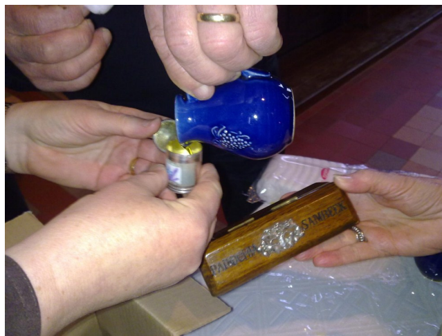
Paasoliën voor kerklocatie Sambeek

O.I. Voorts is er de olie v.d. zieken, aangeduid met Oleum Salutis (Olie van het Heil) of O.I. (of O.Inf.) dat staat voor Oleum Infirmorum (Olie voor de zieken).