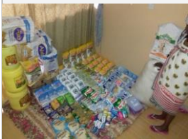
Voeding die klaar ligt op het afhaal-kantoor.

Weeskinderen krijgen voorlichting over hygiene tijdens Covid-19